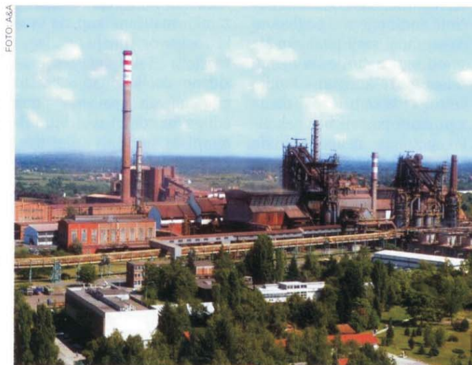
Radnici 'U.S. Steel'-a su vrlo brzo prihvatili nova pravila igre

Navedeni podaci obeshrabuju i ukazuju da je deindustrijalizacija Srbije u punom jeku a kraj tog procesa se i dalje ne nazire. Urušavanje tog važnog dela privrede mogla bi sprečiti jedino čvrsta osnova koju bi država postavila na temeljima nove strategije industrijskog razvoja zemlje. Hoće li se najzad pojaviti svetlo na kraju tunela ili će se obistiniti sve popularnija krilatica radnika koji sa nešto otpremnine u džepu napuštaju fabrike i pozdravljaju se rečima „ko poslednji izade, neka ugasi svetlo“, pitaju se u Industrijskom sindikatu Srbije. ■