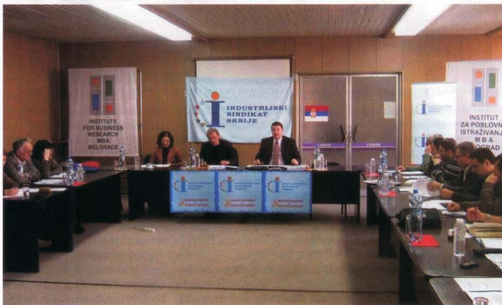
Za Industrijski sindikat Srbije otvaranje novih radnih mesta je imperativ koji nema alternativu