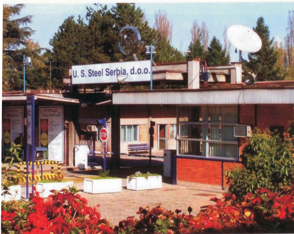
Ima i pozitivnih primera privatizacije, kao što je slučaj sa prodajom smederevske železare Americancima

kraju je rezultiralo aferom u kojoj su prozivani naši političari a ne Amerikanci.